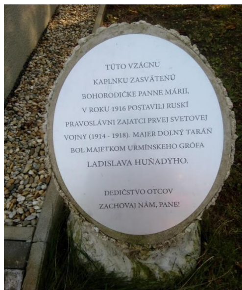
Text a foto GK a KK

Samozrejme, pokiaľ to situácia dovoľí, tak pokračujeme v naplánovaných výletoch – na Nitriansky hrad, do divadla, budeme pokračovať v zdokonaľovaní na počítačoch a v záujme zdravia i v pohybových aktivitách. Verme, tak ako v histórii, takéto pandémie a bolo ich neúrekom sa postupne prekonali a život sa vráti do normálnych koľají. Momentálne nám iné nezostáva, len čakať a chrániť sa. Mimochodom ak máte internet môžete pozerať predstavenia divadla SND doma. Bližšie informácie získate na stránke https://navstevnik.online/ Dlhodobó vypredané činoherné, operné a tanečné predstavenia, muzikály a aj koncerty klasickej hudby si bez cestovania a za cenu jednej vstupenky môže pozrieť celá rodina.